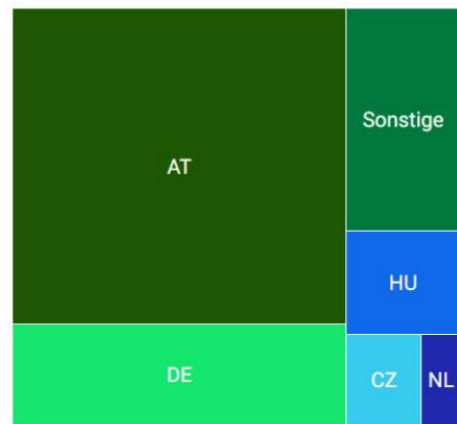
Markt-Anteile nach ÜN