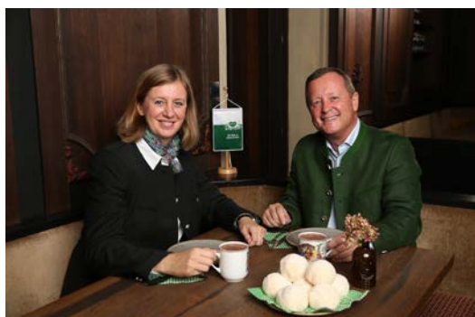
Foto PK anbei: Der erste kulinarische Vorgeschmack auf den Steiermark-Winter 2017/18.

Der Winter in der Steiermark kann ruhig rasant kommen, lautet das Motto doch ganz einfach: Von ganzem Herzen Winter. Alle Infos und Fotos: www.steiermark.com